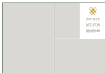
Página Parcial Nível 1 1/4 pág.