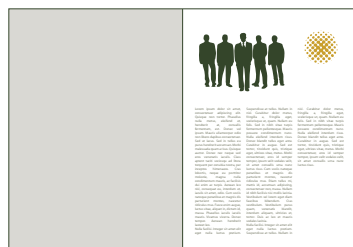
Página Simples Nível 3 1 pág.