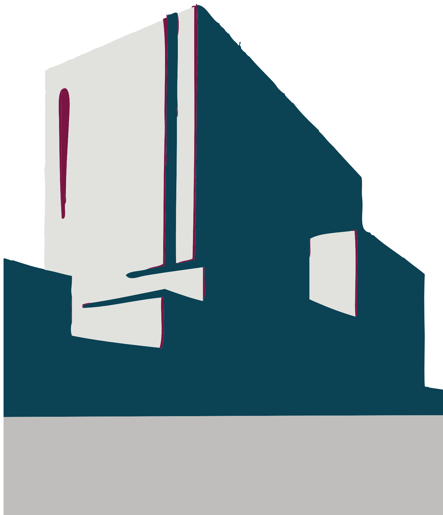
Imagem institucional da Sociedade de Advogados